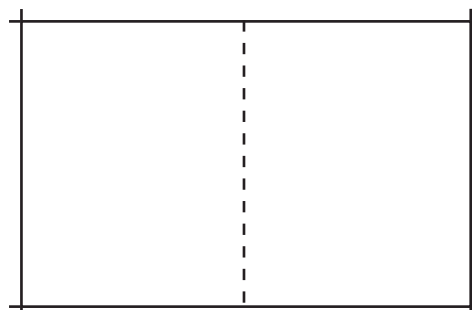
UPPSLAG 500 X 320MM 19 900 KR